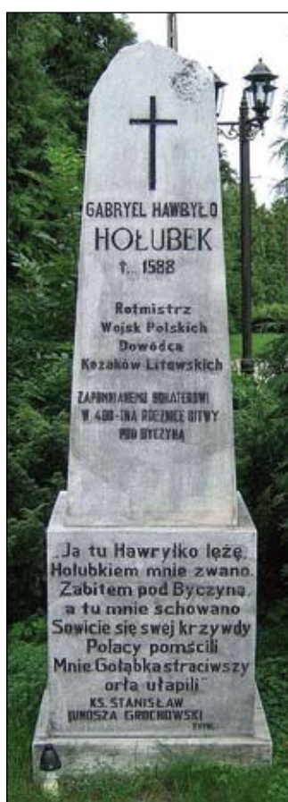
Obelisk w miejscu pochówku Gabriela Hołubka, w Grębaninie (obok kościoła parafialnego). Na nagrobku cytat z wiersza ks. Stanisława Grochowskiego.

Wraz z Hołubkiem w zamku było jeszcze 100 kozaków oraz nie znana liczba górników starosty rabsztyńskiego, a zapewne i olkuskich gwardii. Najpierw załoga rabsztyńska odparła atak wojsk hetmana nadwornego koronnego, Jana Zborowskiego. Żołnierze Zborowskiego chcieli wziąć Rabsztyn zaskoczenia, ale im się to nie udało, potracili przy tym wielu ludzi (sam Hołubek „kilkanaście człowieka postrzelano”). Maksymilian żądał wówczas poddania Rabsztyna, ale jego posłańcom, jak przekazali świadkowie, Hołubek nie otworzył bram zamku, a: „jako że był zły gęby odpowiedział, że już więcej innych między Polakami zdradziec nie ma oprócz tych którzy u Maksymiliana”. Koniec końców odstąpiono od oblężenia Rabsztyna i ruszono pod Kraków. Wnet stolica Rzeczypospolitej została otoczona, ale żołnierze arcyksięcia potrzebowali z monarchii habsburskiej posiłków i zaopatrzenia. Na ich drodze był jednak Rabsztyn, a w nim Hołubek. Pierwsze posiłki wystawione przez biskupów olomunieckiego i wrocławskiego oraz namiestników Górnych i Dolnych Łużyc przekroczyły granicę w połowie października. W ich skład wchodziło 150 konnych juników, 200 żołnierzy pieszych oraz